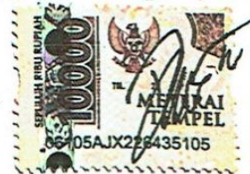
Iffa Ainur Rozi