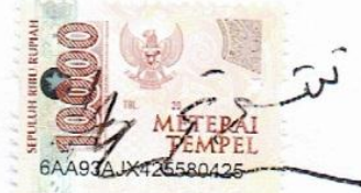
Moch Sadam Ubaidillah