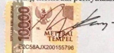
Wenny Widiah Utami