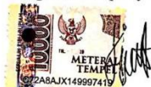
Nabila Intan Puteri