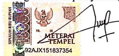
Nur'aini Octavia Prayitno