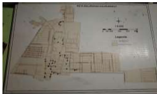
Gambar 1. Denah Lokasi Wilayah Kecamatan Rungkut

Tujuan Umum Menciptakan kondisi daerah tinggal (kampung) yang aman dan aman bagi proses tumbuh kembang anak dalam dukungan masyarakat yang menjamin pemenuhan hak anak dan mengupayakan perlindungan anak secara optimal. Kondisi Wilayah RW 14 terdiri dari 4 RT. Sumber daya manusia jumlah penduduk KK 7.124 = 22. 474 jiwa terdiri dari 15 RW 86 RT.