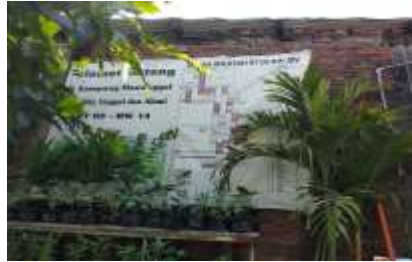
Gambar 7. Tanaman Toga yang ditanam oleh warga

Pemanfaatan TOGA; untuk memenuhi keperluan alam bagi kehidupan, termasuk keperluan untuk mengatasi masalah-masalah kesehatan secara tradisional (obat). Kenyataan menunjukkan bahwa obat yang berasal dari sumber bahan alami khususnya tanaman telah memperlihatkan peranannya dalam penyelenggaraan upaya-upaya kesehatan masyarakat. Pemanfaatan TOGA yang digunakan untuk pengobatan gangguan kesehatan keluarga menurut gejala umum adalah: Demam panas, Batuk, Sakit perut, dan Gatal-gatal.