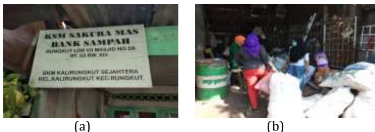
Gambar 9. Bank Sampah (a) Tempat Bank Sampah (b) Kegiatan yang dilakukan warga

Ruang Ekspresi (Kelompok Rebana Putri), Bank Sampah, Daur Ulang dan Hidroponik. Itu semua merupakan hasil dari UMKM untuk menetapkan identitas dirinya di persaingan dunia bisnis karena adanya keterbatasan kemampuan. Perkembangan di bidang teknologi informasi adalah salah satu faktor yang mempengaruhi peningkatan persaingan bisnis pada pasar regional maupun global. Dengan adanya faktor perkembangan teknologi informasi, produsen diharapkan mampu menawarkan dan menghasilkan produk yang memiliki keunikan tinggi dan inovatif pada pasarnya (Raden, 2019).