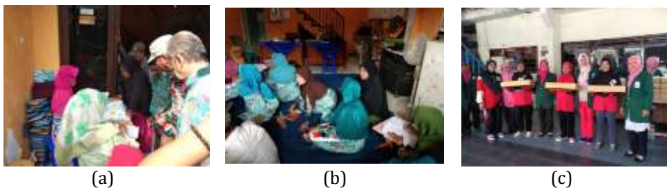
Gambar 6. Kegiatan Posyandu Lansia Sakura