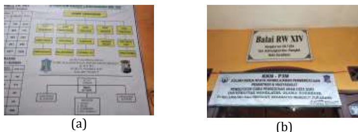
Gambar 11. Kampung aman (a) Susunan struktur organisasi sie keamanan RW 14 (b) Balai RW 14

Kampung aman pada RW 14 terletak RT 01 dan RT 03 dimana area kampung tersebut memiliki lalu lintas yang berguna untuk keselamatan warga sekitar terutama untuk anak – anak.