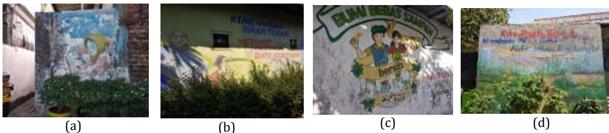
Gambar 8. (a) Mural Siramilah Tanaman (b) Mural merawat lingkungan suatu kebutuhan (c) Mural Bumi Bebas Sampah (d) Mural tentang kebersihan lingkungan

Pembelajaran tentang lingkungan hijau pada masyarakat khususnya pada anak – anak adalah yang paling utama karena dengan mengajarkannya tentang lingkungan hijau dan tanaman maka mereka akan sadar betapa pentingnya tanaman bagi manusia dan lingkungan mereka agar tetap sejuk dan indah dan memberi sisi positif bagi kesehatan. Pada RW 14, RT 03 mendidik anak – anak tentang lingkungan menggunakan gambar mural tentang menjaga lingkungan dan tanaman