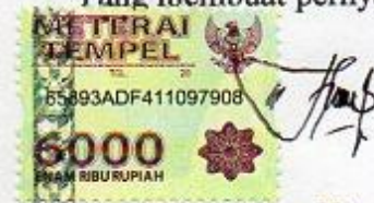
Indah Setya Utami