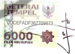
Novita Ndari Utoyo