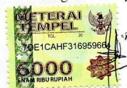
Siti Nur Halimah