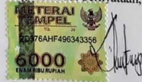
Putri Restu Anggraeni