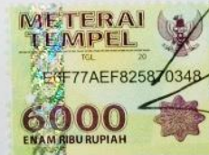
Triska Aprilia Pratiwi