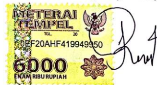
Reza Nabilla Fitria Farah