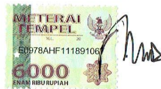
Bayu Octa Prasetya