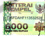
Arifbillah Razaba Suprayogi

Surabaya, 13 November 2019 Yang membuat pernyataan,