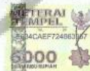
Nur Maghifrotu Chusnita