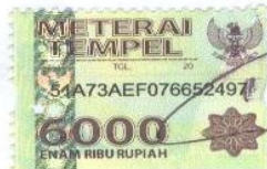
Afrida Nur Faricha