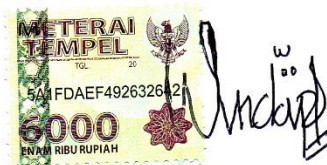
Winda Putri Lestari

Surabaya, 1 April 2017 Yang membuat pernyataan