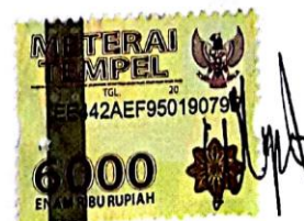
Wignyo Ady Setyanto

Surabaya, 21 April 2018 Yang membuat pernyataan,