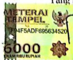
Dyah Putri Pratiwi