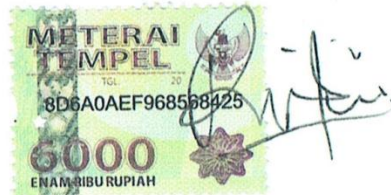
Rizki Nurul Amalaq